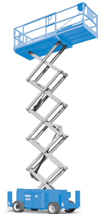
07/15 Part No. B127284FR