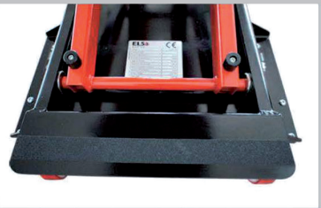
Functional chassis design for easy cleaning Design fonctionnel pour un nettoyage facile