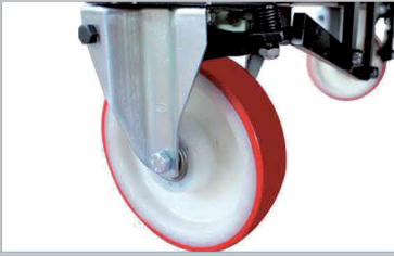
Auto braking on castors Freinage automatique sur les roulettes