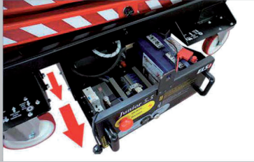
All the component parts are easily accessible for servicing La partie composant est facilement accessible