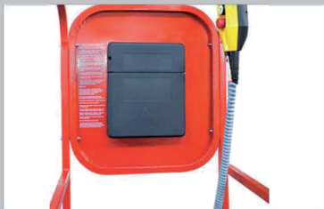
Operator briefcase Malette de l'opérateur