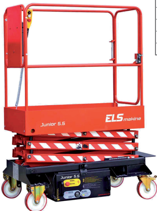
Outstanding capacity provides long endurance Les batteries à forte capacité permettent une longue période de travail