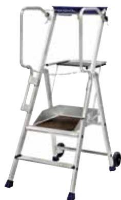
F2 hauteur de travail 2,45 m