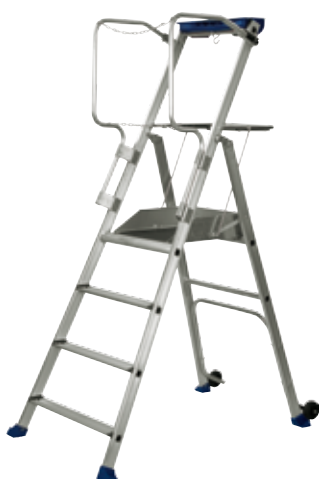
F4 hauteur de travail 2,95 m