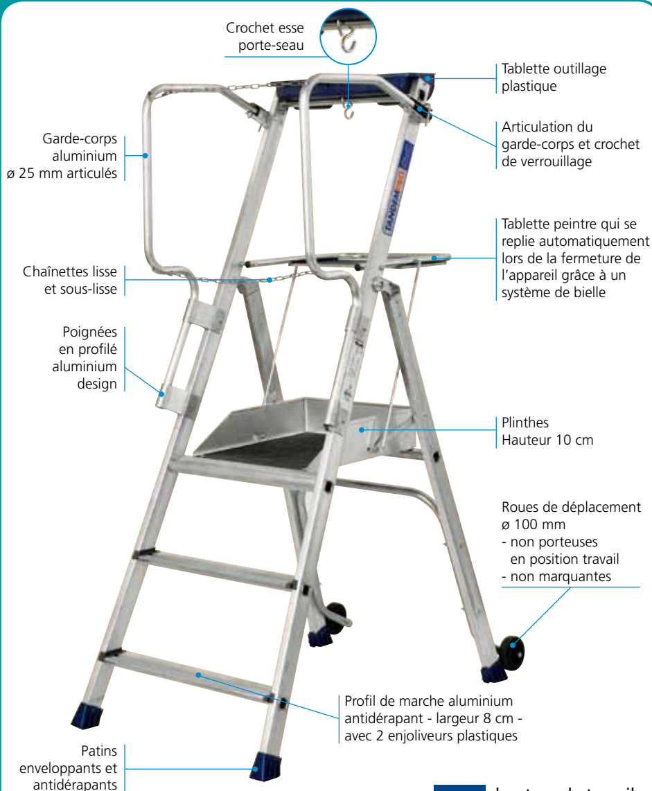
F3 hauteur de travail 2,70 m