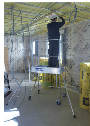
Rolly mini H. travail 2,90 m