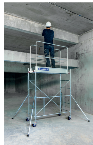
Rolly H. travail 3,80 m