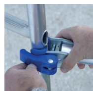
Système de liaison Ergoblock® breveté, blocage fiable d'un seul geste

Les stabilisateurs se règlent en longueur pour pouvoir s'adapter en fonction de la hauteur. Decalage de niveau intégré.