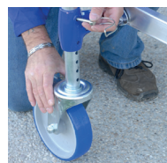
Roues diam. 200mm à blocage réglables sur 175 mm et tous les 12,5 mm