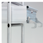
Plancher bac avec plinthes intégrées et crochets ergonomiques